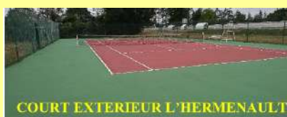
COURT EXTERIEUR L'HERMENAUT