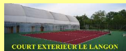
COURT EXTERIEUR LE LANGON