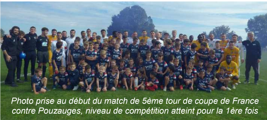
Photo prise au début du match de 5ème tour de coupe de France contre Pouzauges, niveau de compétition atteint pour la 1ère fois

Le Football Club Plaine et Bocage réunit 5 communes environnantes et compte à ce jour environ 300 licenciés.