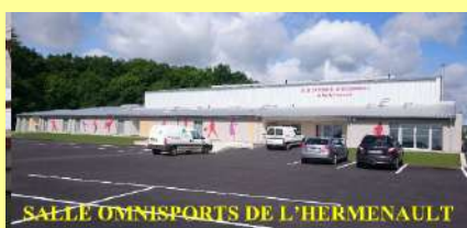
SALLE OMNISPORTS DE L'HERMENAUT