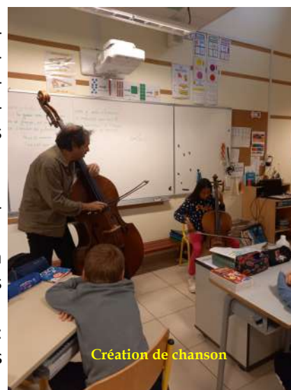
Création de chanson

Il faut maintenant s'entraîner à chanter avant de rencontrer l'école de Longèves et l'école de musique qui participent au même projet.