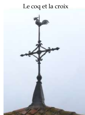
Le coq et la croix

Sur chaque façade du clocher, les baies des abat-sons ont été réparées.