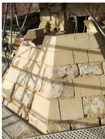
Tourelle pentagonale de montée du clocher

La tourelle pentagonale de montée au clocher est consolidée et sa couverture en pierres de taille est en cours.