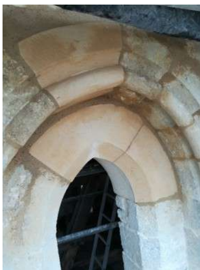
Baies des abat-sons

Au moment des congés de fin d'année, les deux baies seront refaites et vont permettre la reposes des vitraux.