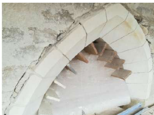
Baies où seront remis les vitraux