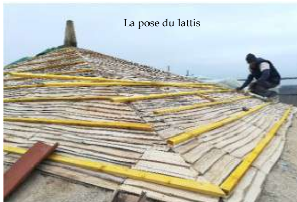
La pose du lattis

Le coq et la croix sont restaurés et seront remis en place dès que la couverture sera terminée.