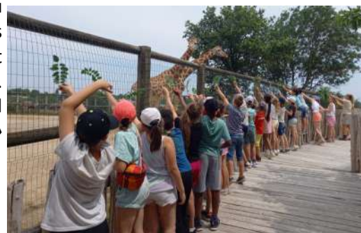
Sortie à Mervent juin 2023

Pour rappel, nous accueillons des élèves tout au long de l'année scolaire et ce, sur tous les niveaux.